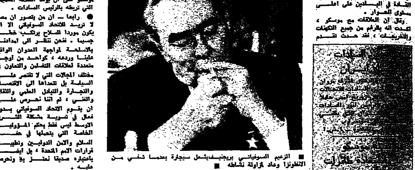
الزعيم السوفياتي بريجنيف يشعل سيجارة بعدما نشي من الاطونزا وعاد ازاوله تشافه

بالتسوية لوضع العلاقات بين البلدين على أساس من الصراحة والتسوية وتوسيع كل طرفه بوزن وتقبل الطرف الآخر والشعور المتبادل بوجود الحفاظ على أطيب العلاقات بين الصديقين.